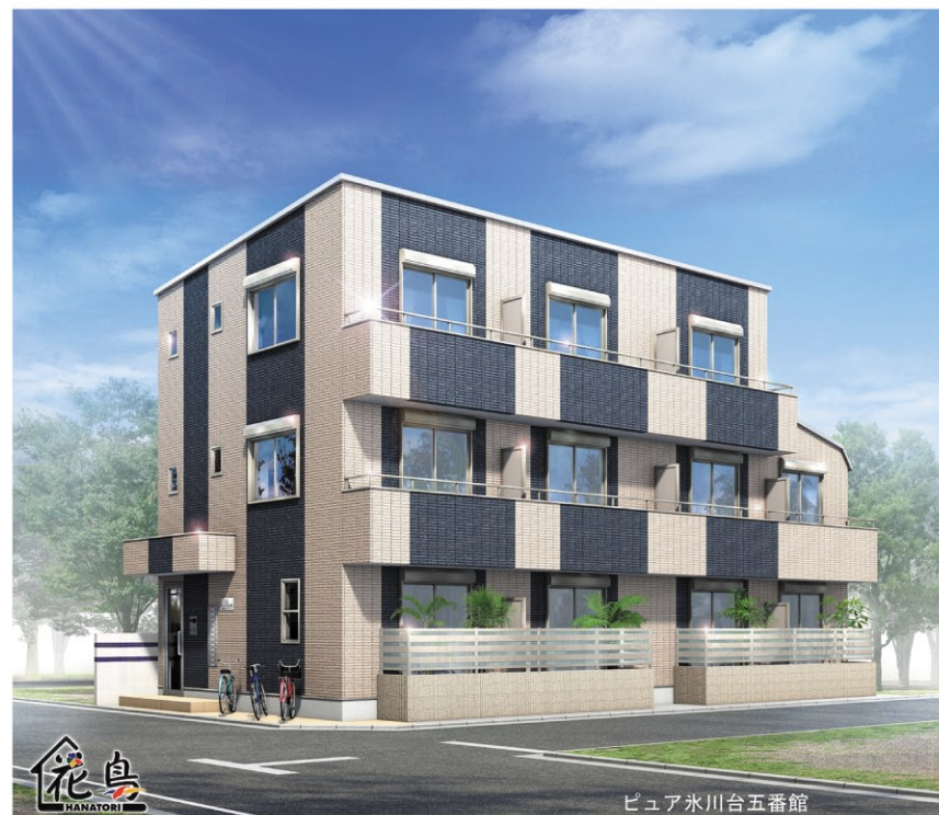
ピュア氷川台五番館

所在地／練馬区氷川台4丁目29番8号(住居表示) 地番／練馬区氷川台4丁目146番7 敷地面積／142.59㎡(43.13坪) 地目／宅地 土地権利／所有権 構造／鉄骨造3階建 床面積／1階97.50㎡・2階97.50㎡ 3階76.70㎡ 合計271.70㎡ 建築確認番号／第NIC16A-00027-01号 (H28.6.10確認済) 加入保険／(株)日本住宅保証検査機構(JI O) 用途地域／第1種低層住居専用地域 建ぺい率／60% 容積率／200% 外壁／ALC板+吹きつけタイル 屋根／ガルバリウム鋼板葺+ALC板 設備／東京ガス・東京都水道・東京電力 耐火建築物 接道状況／南側練馬区道13-118号線幅員6m 東側練馬区道13-142号線幅員4m